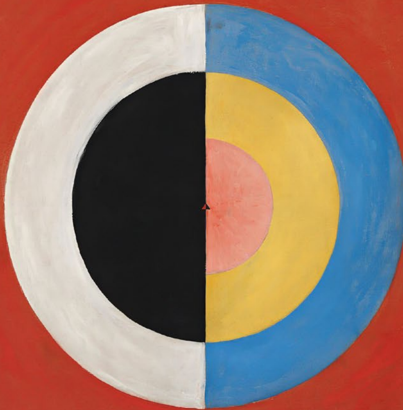
Hilma af Klint, Der Schwan, Nr. 17, Serie SUW, Gruppe IX: Teil 1, 1915, Öl auf Leinwand, 150,5 × 152 cm

Die überraschende Aktualität der Malerin Hilma af Klint