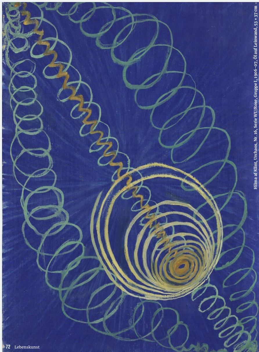
Hilma af Klint, Urchaos, Nr. 16, Serie WU/Rose, Gruppe I, 1906–07, Öl auf Leinwand, 53 x 37 cm

Von hier aus zeigt sich ein weiterer eminent lebensweltlicher Aspekt solcher Kunst: Indem sie die Ebene getrennt erscheinender Phänomene gleichsam durchschreitet, hin zur darunter liegenden Dimension der Wirklichkeit, entmachtet sie die absolute Vormacht logisch-kausaler, linearer Muster. Gibt es doch, etwa in Bezug auf die Zeit, nur auf der Außenseite der Welt – in der Realität – eine strikt lineare Abfolge von Vergangenheit, Gegenwart und Zukunft. Im Weltinnenraum – der Wirklichkeit – hingegen waltet jenes, um bei Hans-Peter Dürrs Diktion zu bleiben, »Sowohl – als auch«, das Vergangenheit, Gegenwart und Zukunft in Allgegenwart einbettet. Wo es mithin die Freiheit gibt, Orientierung nicht mehr nur aus logisch-kausalen Mustern der Vergangenheit und Gegenwart zu gewinnen, sondern genauso auch aus dem Potenzialraum, den wir Zukunft nennen. Ein ästhetisch verlebendigtes Wahrnehmen kann sich mit der »Werdekraft« der Welt, den »formenden Kräften« (Paul Klee) verbinden, woraus