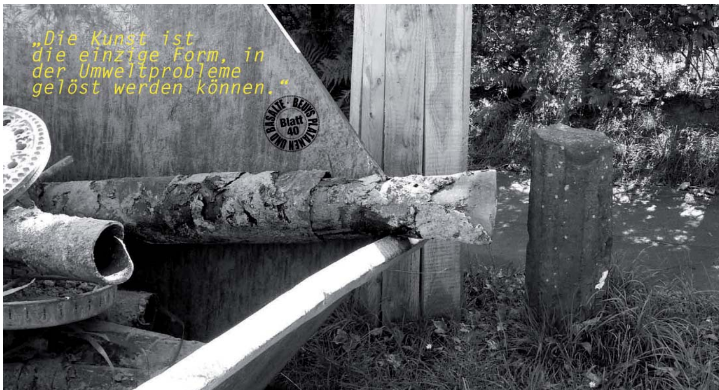
Zitat Joseph Beuys

auferlegte Abtrennung des modernen Menschen vom lebenden Ganzen zu überwinden, wofür ein Verlebendigen des Wahrnehmens zentral ist. Provokant, spannungsreich erprobte er kreative Strategien, um Automatismen, in denen das Wahrnehmen gefangen ist, zu durchbrechen und eingefleischte Denkgewohnheiten zu konterkarieren. Damit Bewusstheit entsteht – wodurch die lebendige Mitwelt, in der Moderne zum Ding gemacht, neu zum Du werden kann. Tatsächlich mehren sich gegenwärtig im Anthropozän-Diskurs wie auch im Horizont der Nachhaltigkeit Erkundungen, die in eben diese Richtung zielen, entlang der Frage: Wie lassen sich die Sphären des Sozialen, des Rechts und des Politischen so erweitern, dass die Natur oder vielmehr das lebende System Erde nicht mehr als Ressource betrachtet wird, sondern als Du, als Wirkmacht, als Akteur, mit dem es sich zu verständigen gilt?